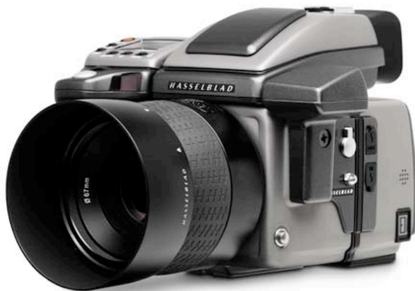
H3DII avec dispositif d'enregistrement GIL GPS.