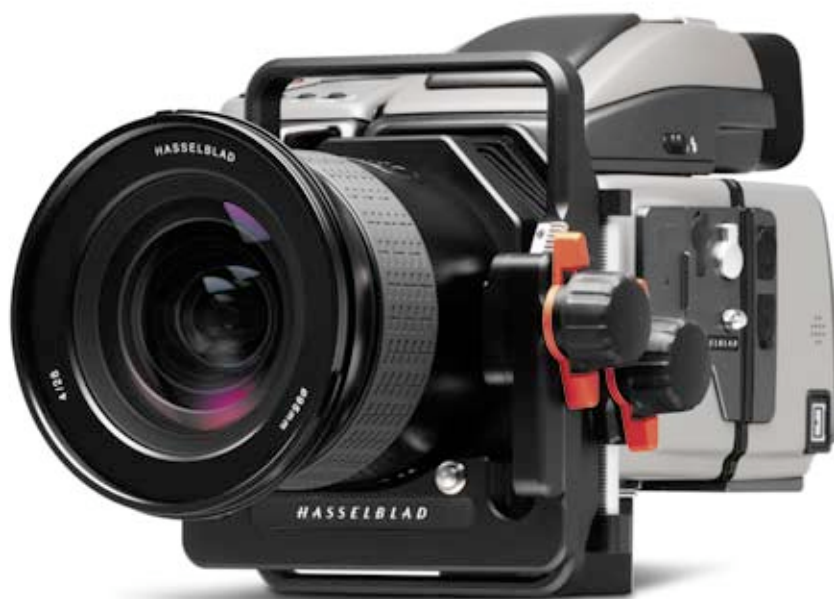
H3DII avec adaptateur HTS 1.5 tilt/shift et objectif HCD 28 mm.

Voir la fiche technique de la chambre photographique Hasselblad pour plus de détails.