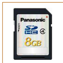
Carte mémoire SDHC 8 Go Réf. : RP-SDP08GE1K Code EAN : 5025232531103