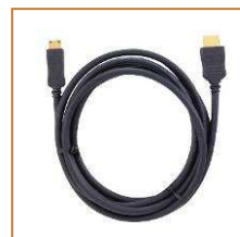
Câble mini-HDMI 1.5m Réf. : RP-CDHM15E-K Code EAN : 5025232457021