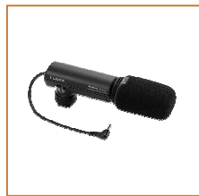
Micro stéréo externe Réf. : DMW-MS1E Code EAN : 5025232528141