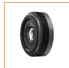
Objectif pancake 20mm F1.7 Réf. : H-H020E Code EAN : 5025232537358